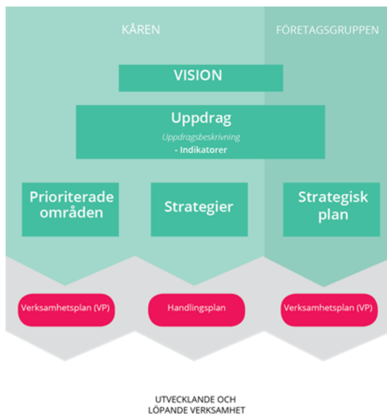
Figur 2. Visualisering av kårens visionsarbete.

Grunden för allt arbete inom kåren är visionen att alla medlemmar ska trivas och utvecklas under hela sin chalmertid . För att levandegöra visionen och säkerställa att allt arbete strävar mot att uppnå den har kåren valt att åta sig elva uppdrag gentemot medlemmarna. Allt kårens löpande och utvecklande arbete sker inom ramen för uppdragen och beskrivs i bland annat kårens verksamhetsplan, handlingsplaner (Figur 2), Kårledningens arbetsbeskrivning samt kommittéernas instruktioner och verksamhetsplaner. Kårens verksamhetsstyrning vilar på en demokratisk grund, där vision och uppdrag är antagna genom Fullmäktige.